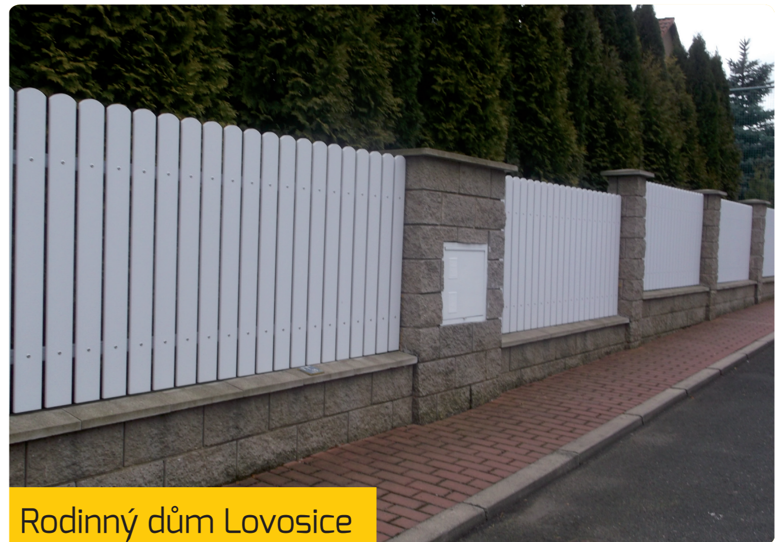
Rodinný dům Lovosice