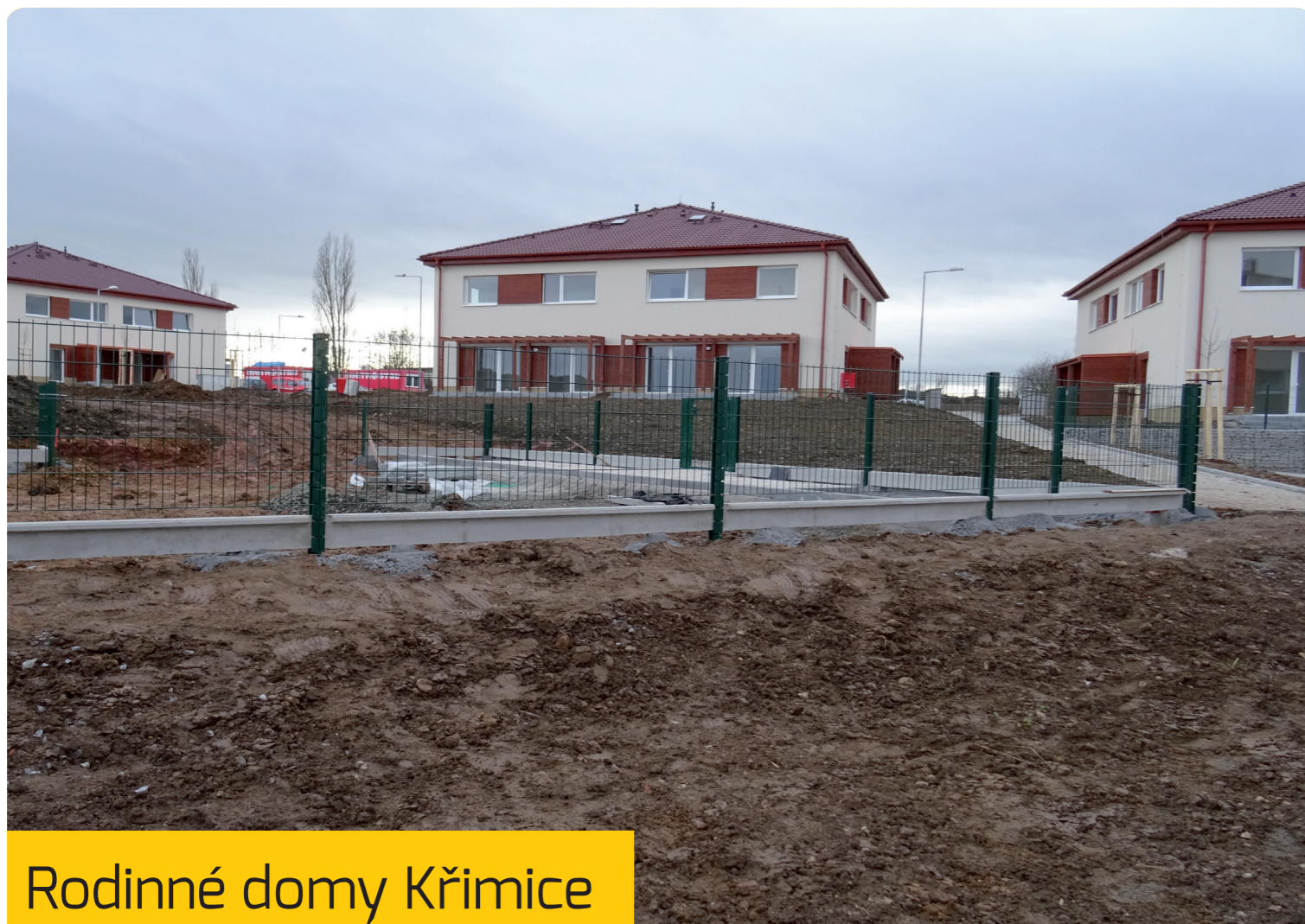
Rodinné domy Křimice