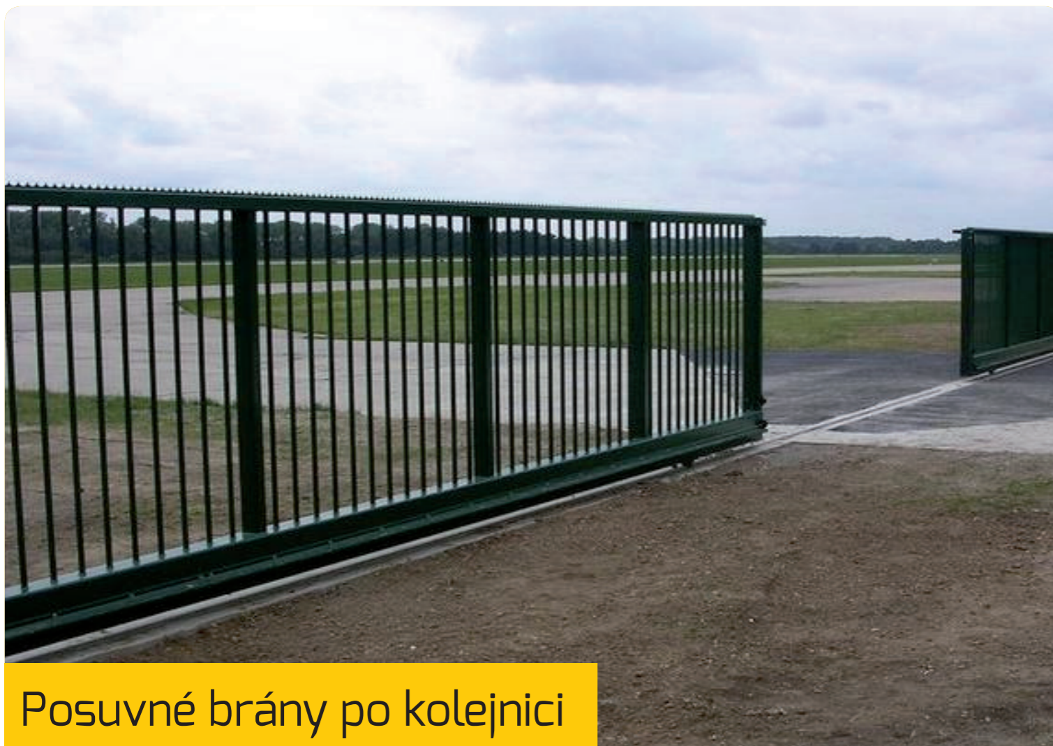
Posuvné brány po kolejnici