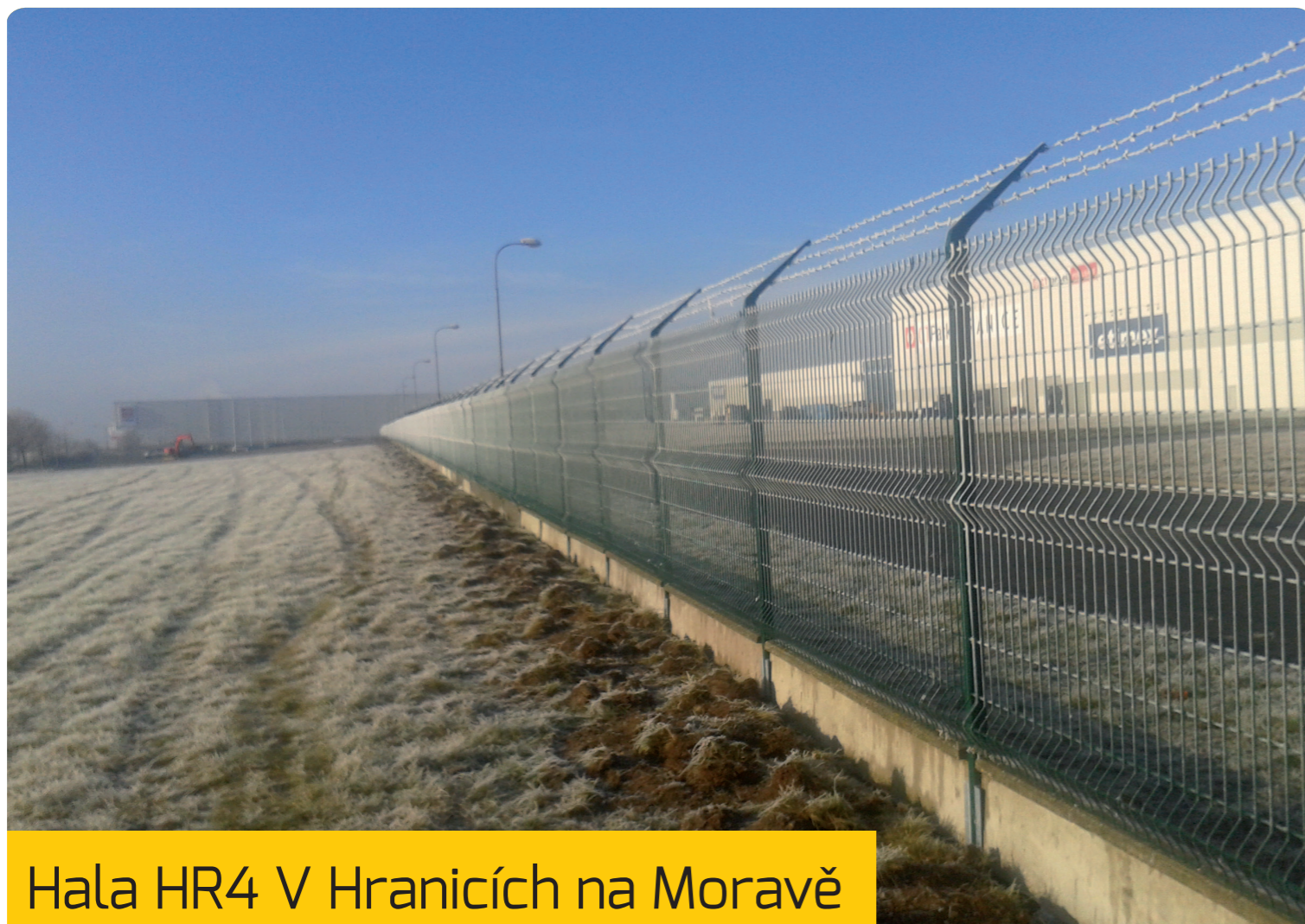
Hala HR4 V Hranicích na Moravě