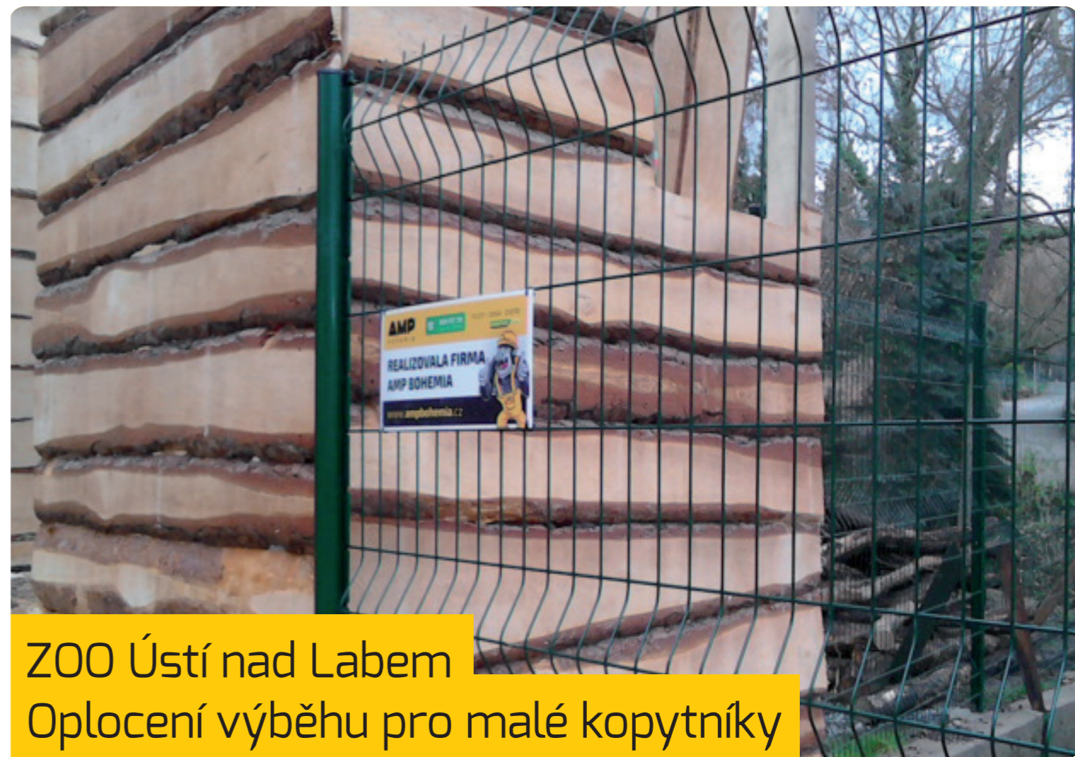
ZOO Ústí nad Labem Oplocení výběhu pro malé kopytníky