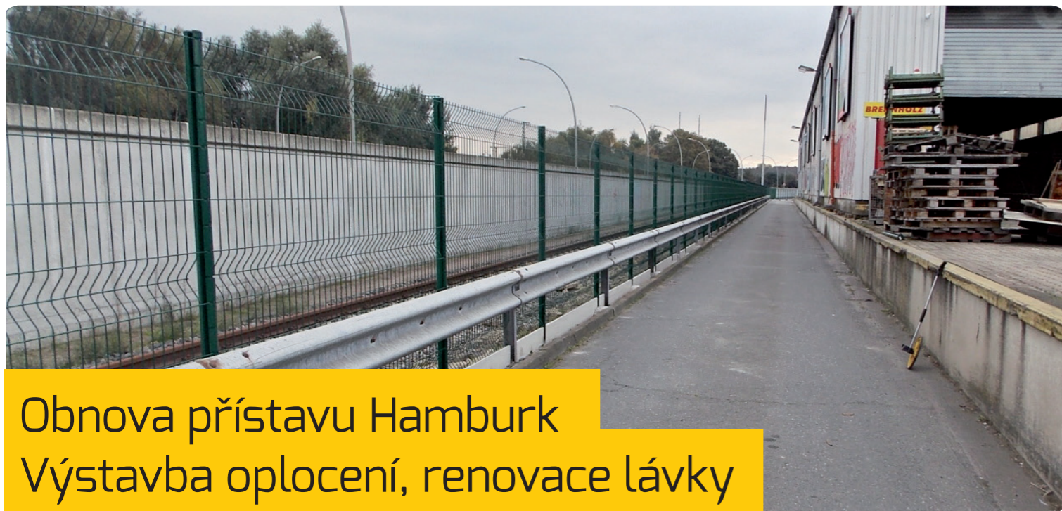
Obnova přístavu Hamburk Výstavba oplocení, renovace lávky