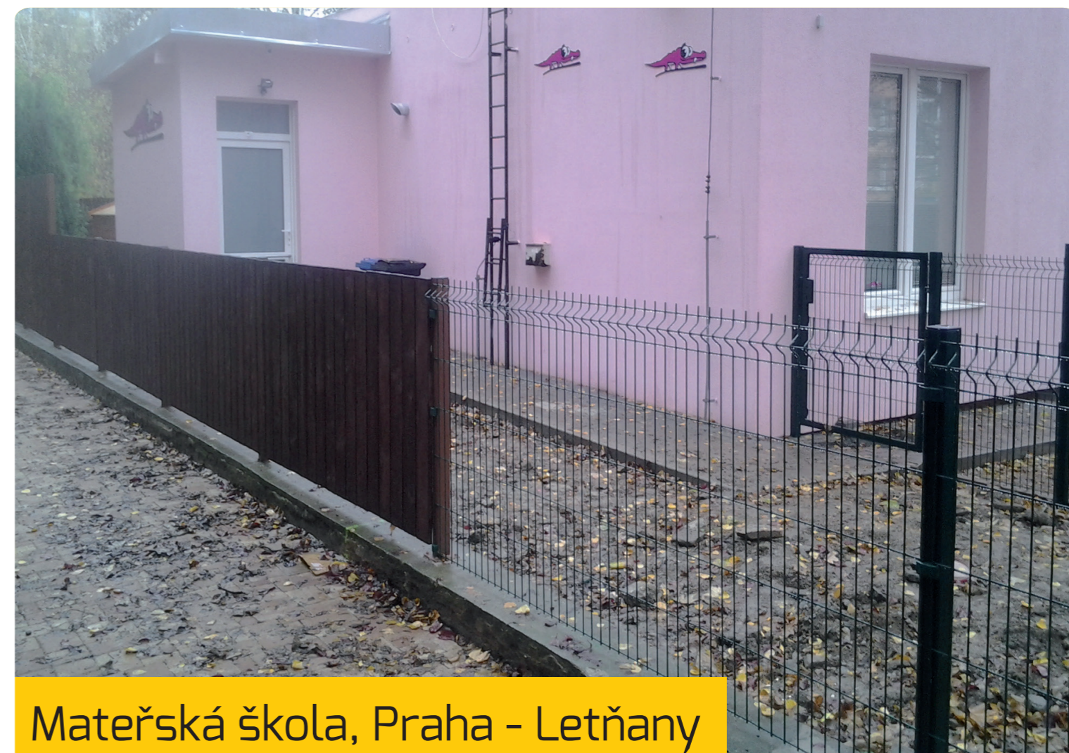
Mateřská škola, Praha - Letňany