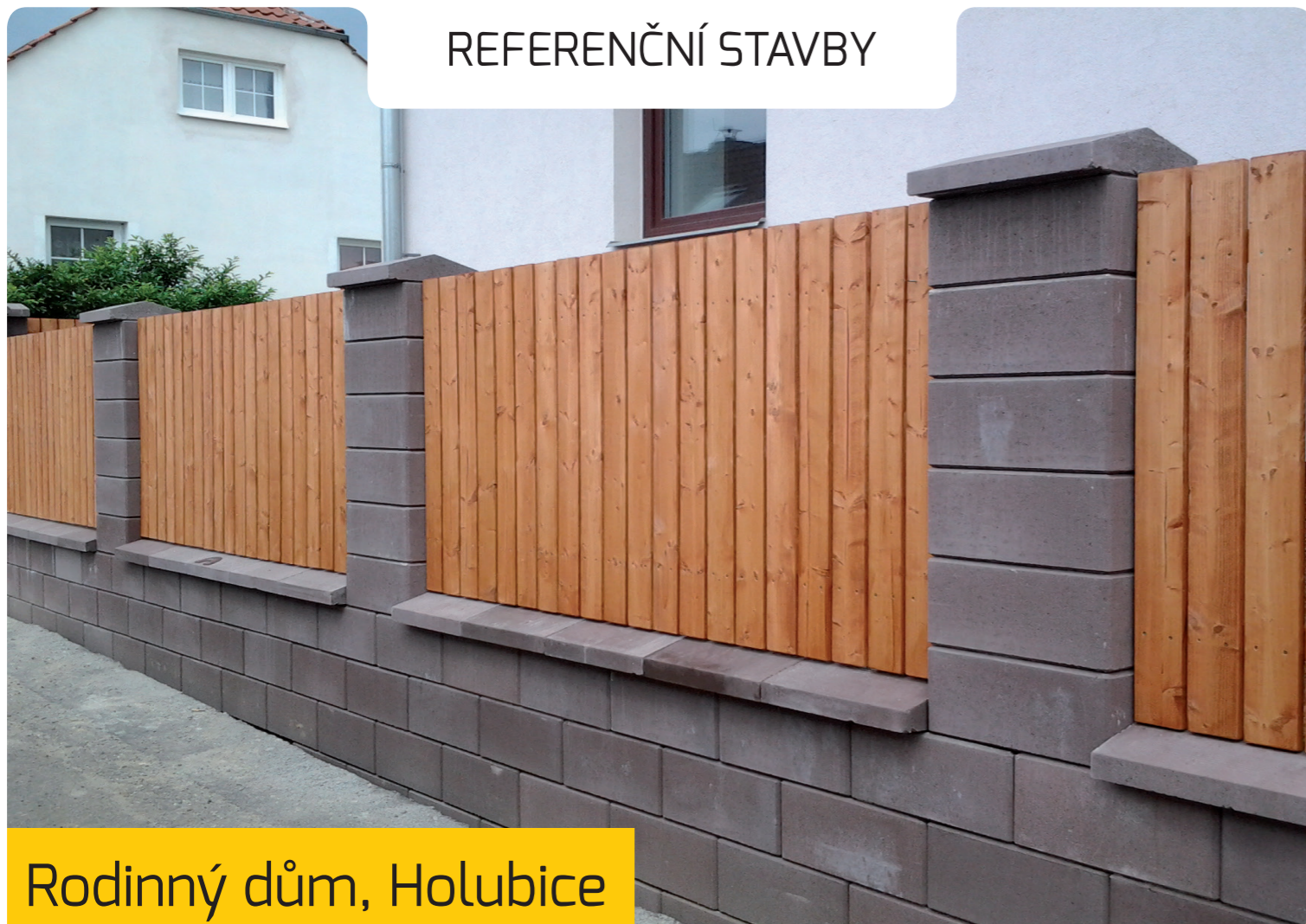
Rodinný dům, Holubice