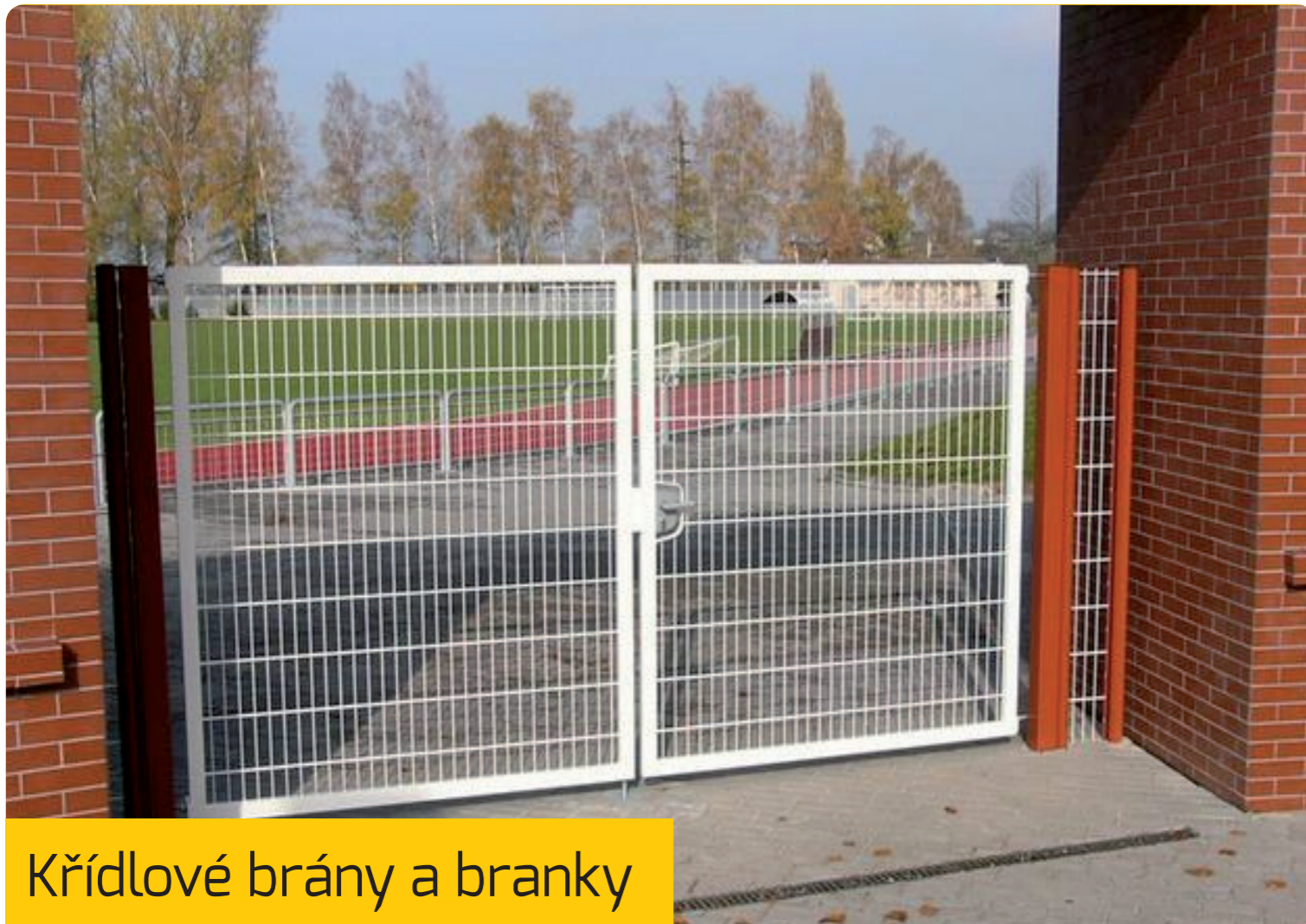
Křídlové brány a branky